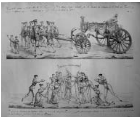
Fig. 3: Carruatge Reial i Comparsa, visita dels reis a Terrassa (1828), Palau Antiguitats, núm. G-500525-1

ques, el primers, i danses del país, els segons (fig. 3). 24 Després que els reis es retiressin es repetiren aquests balls en quatre punts diferents de la vila. 25