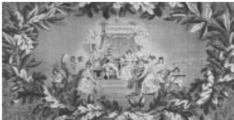
Fig. 2: Ferran VII i Maria Cristina de Nàpols (1829), Centre de Documentació i Museu Tèxtil, Terrassa, CDMT, reg. núm. 465.

Testimoni de com hauria de ser el treball tèxtil dels vilatans de Terrassa per mostrar el seu vassallatge i agraïment als sobirans és el teixit brodat un any més tard (fig. 2), que es conserva en els fons del Museu Tèxtil de la ciutat. Es tracta d'una tela estampada en motiu del casament de Ferran VII amb Maria Cristina de Nàpols, l'any 1829. 22 S'hi veuen els reis rodejats de les al·legories de les Arts i de la Indústria tèxtil. Es poden llegir unes inicials a la bala del costat dret: H. D. C., que segurament corresponen al dissenyador. 23