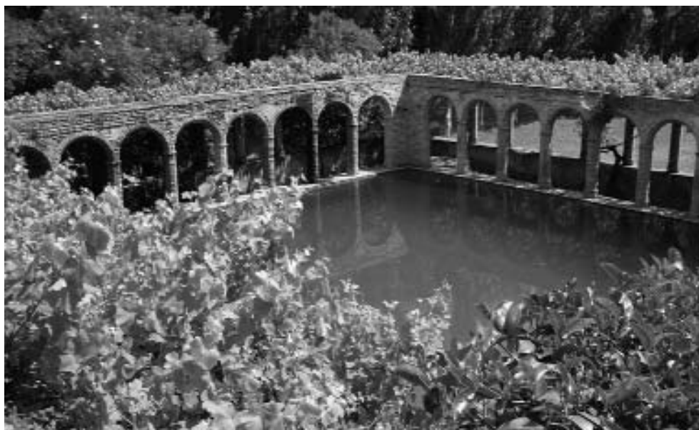
Can Clota: Bassa

projectes que s'estaven desenvolupant en el 2011. A continuació el baró va ensenyar als socis la finca, els quals van poder gaudir dels diferents espais de l'edifici i del contingut artístic i bibliòfil en els salons, les biblioteques, la terrassa..., així com dels espais annexos: l'església i els jardins. A l'ombra dels arbres i la vegetació del jardí i davant d'un paisatge dominat per l'home, la pèrgola, la terrassa i la torre de can Clota vam celebrar l'aniversari. Una jornada que es va iniciar al matí i es va perllongar fins a la tarda. En finalitzar el dia, el baró va obsequiar els assistents amb oli extra verge de les seves finques.