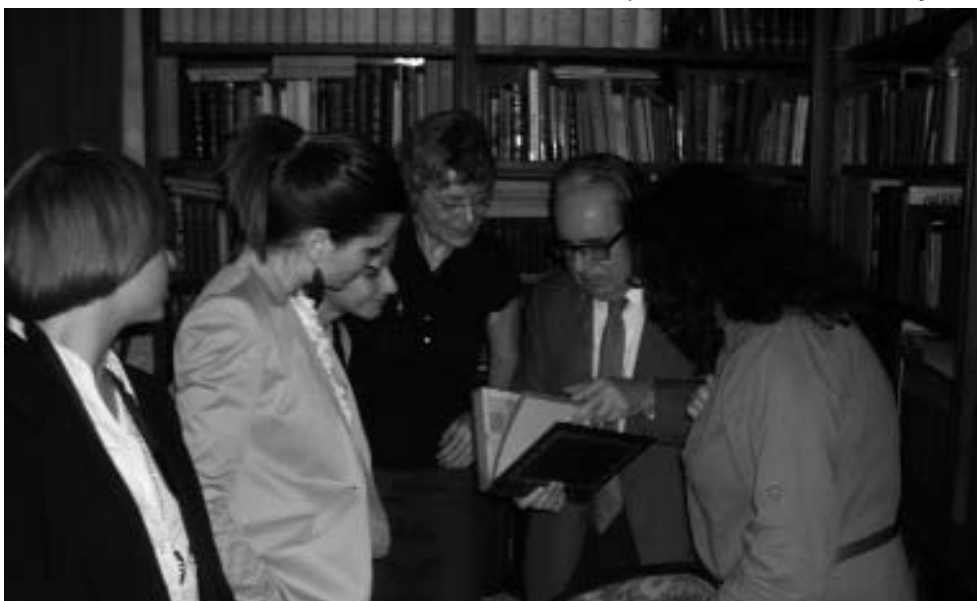
Can Clota: Biblioteca (Emblecat: Arxiu fotogràfic)

El baró de Vilagayà va oferir can Clota el 21 de maig per celebrar el primer aniversari de la singladura d'Emblecat. Can Clota, un edifici del segle XIV amb diferents intervencions en segles posteriors, va ser un marc extraordinari per acollir els socis i celebrar l'acte. Els socis van ser rebuts a l'entrada de la finca i a continuació van ser conduïts al saló, en el qual la presidenta d'EMBLECAT va realitzar una síntesi o memòria de les activitats consolidades durant l'any 2010, i va fer un avanç dels