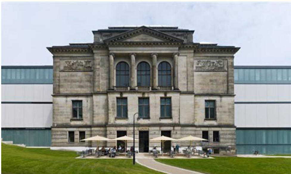
La Kunsthalle Bremen, acull la col·lecció del "Kunstverein in Bremen"

L'estada que darrerament he viscut a la ciutat de Bremen al nord-oest d'Alemanya, com a assistenta de producció en el departament d'exposicions del Künstlerhaus Bremen, i la meva posterior incorporació com a coordinadora d'exposicions a l'equip de la GAK Gesellschaft für Aktuelle Kunst ha permès la presentació d'aquesta aproximació al panorama artístic de la ciutat extensible a la manera de fer, quant a la gestió de l'art i els seus espais d'exhibició, a tot el país. La feina realitzada en aquestes institucions, un centre de producció d'art que uneix espais de treball per a artistes amb una sala d'exposicions de caràcter internacional, la primera, i un espai d'exposició de projectes d'artistes emergents, la segona, va servir per a realitzar un treball sobre un tipus d'institució artística de naturalesa associativa, el Kunstverein, del qual presentem aquí una breu introducció.