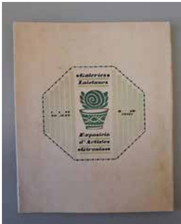
Fig. 3. Catàleg Exposició Artistes Gironins (1918). MNAC. Secció petits catàlegs.

Les exposicions de vidre i ceràmica moderna, s'alternaven amb mostres sobre vidre antic així com de ceràmica popular catalana, de Talavera o pots d'apotecari. No cal dir que tota aquesta activitat expositiva comptava amb un suport mediàtic: Josep M. Junoy, Feliu Elias (1878-1948), Josep Llorens Artigas (1892-1980), Joaquim Folch i Torres o Romà Jori publicaven ressenyes, sovint apologètiques, des de diferents plataformes editorials vinculades a les Laietanes, aspecte que el curt espai de què disposem impedeix analitzar. 8 Els anuncis, notes de premsa així com els petits catàlegs que es van publicar, conservats en part a la Biblioteca del MNAC, permeten traçar una cartografia de la vida artística de les Galeries