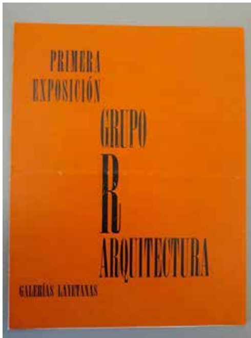
Fig.7. Portada del catàleg de la Primera Exposició Grup R (1948). MNAC. Secció petits catàlegs.

UGT fins al bàndol contrari com és el cas de l'exposició dedicada al pintor del moviment nacional Bertuchi (Sala 1998). No cal insistir en el fet que la immediata postguerra és temps de repressió i migradesa i la cultura catalana, com afirma Jaume Vidal, s'ha d'organitzar en la clandestinitat. Però amb el rerefons de la Segona Guerra Mundial hi ha, també, un fenomen de reactivació de l'economia i de retruc, del mercat artístic barceloní, que s'ha anomenat 'l'art de l'estraperlo'. Les Galeries Laietanes (d'ara en endavant Layetanas, com havia succeït en temps de la dictadura de Primo de Rivera, moments en què la llengua catalana és proscriu) continua sent un guèiser d'on brollen espurnes avantguardistes. El context artístic ha estat relatat pels seus actors principals