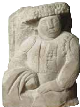
Fig. 4. Manolo Hugué, Torero , 1913. MNAC 010219

punt de venda comercial de ceràmica i vidre, cristalleria, perfums i tota mena d'objectes de fantasia i de regal. Entre 1916 i 1918, cal consignar algunes exposicions agitadaes pels aires avantguardistes propiciades per Salvat Papasseit (1894-1924), director de la llibreria de les Laietanes. Rafael Barradas (1890-1929), l'introduïdor del futurisme, hi celebrava la primera exposició individual que ell anomenava 'vibracionista'. Hi va exposar, també, Joaquim Torres-Garcia, tres anys abans de marxar cap a Nova York desil·lusionat per la incomprensió del seu projecte artístic; el fauve salmantí Celso Lagar (1891-1966), instal·lat a Blanes; Daniel Guardiola (?), pintor caigut en l'oblit i, aleshores, qualificat de promesa fauve; Lluís Bagaria (1882-1940), amb les seves caricatures, així com les creacions de l'etapa de Ceret de l'escultor Manolo Hugué (1872-1945), aplaudides en els ambients artístics perquè s'ajustaven als ideals clàssics i mediterranis (fig.4). Fonts primàries conservades donen algunes pistes del sistema de treball del marxant Segura